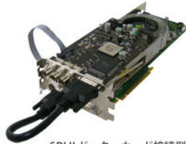
SDI II ドーターカード接続例

入力映像に対してパススルー処理を行うことや、Quadro FX5600によってレンダリングされたグラフィックス画像を用いてアルファ・コンポジット処理やルマキー合成、クロマキー合成を行い、SDI映像として出力することができます。